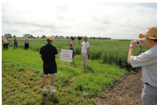
Journée de rencontre –activités participatives de sélection des variétés

Les producteurs biologiques ont eu une profonde influence sur la direction qu'allait prendre le projet. En tant que groupe national de chercheurs en agriculture biologique, nous avons beaucoup questionné les producteurs afin d'établir les facteurs qui les limitaient. Cette approche stratégique a vraiment fonctionné et nous continuons d'en apprendre davantage sur leurs problèmes. Et l'industrie nous informe des tendances des nouveaux marchés. Il est très important d'étudier le marché, car une ferme est une entreprise.